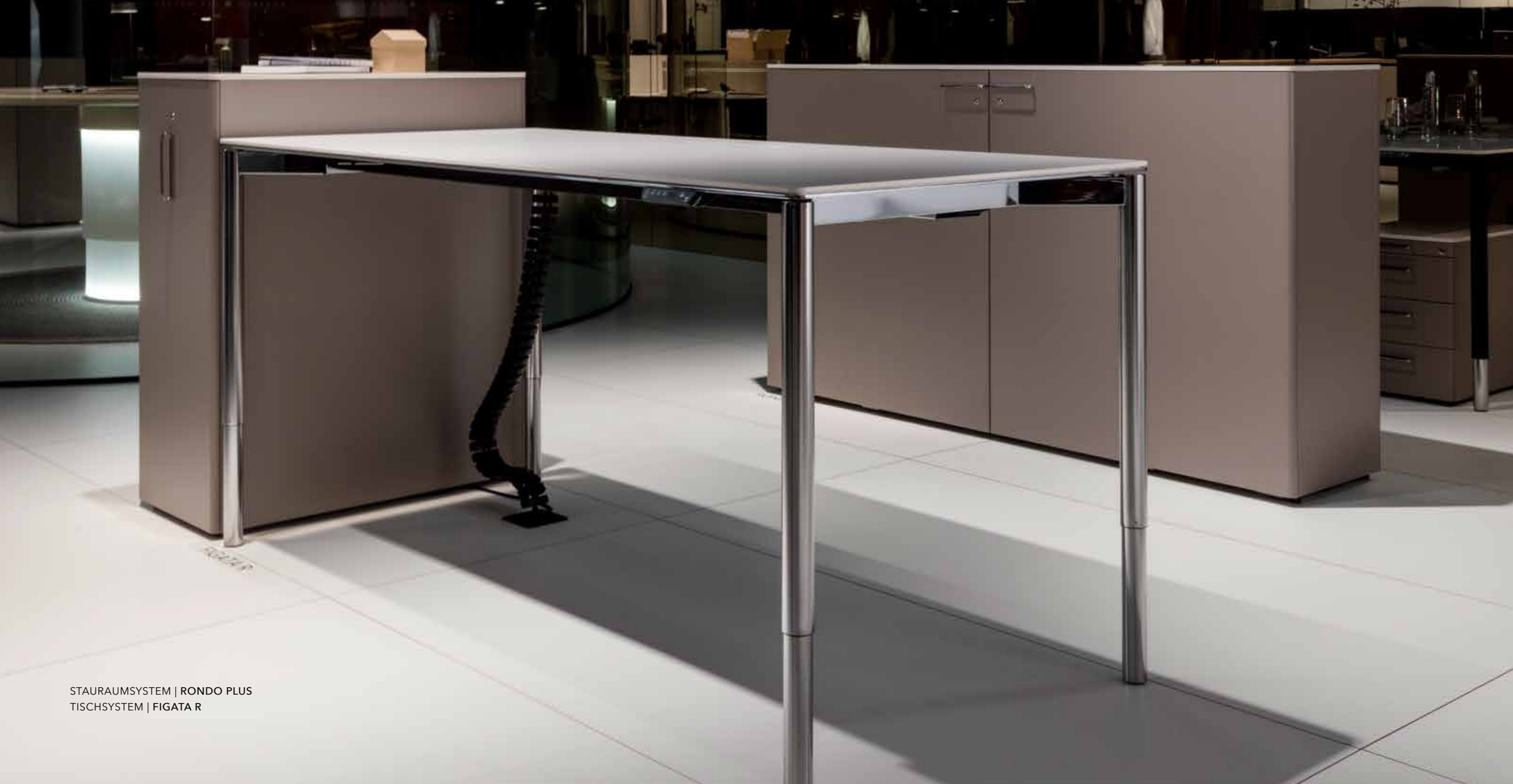
STAURAUMSYSTEM | RONDO PLUS TISCHSYSTEM | FIGATA R

Das elegante Stauraumsystem RONDO erfüllt alle grundlegenden Anforderungen der modernen Büroarbeitswelt. Ein breites Spektrum an hochwertigen Rolladen-, Schiebetüren- und Flügeltürenschränken sowie vielfältigen Rollcontainern bieten flexible Einrichtungsmöglichkeiten für individuelle Anforderungen am Arbeitsplatz.