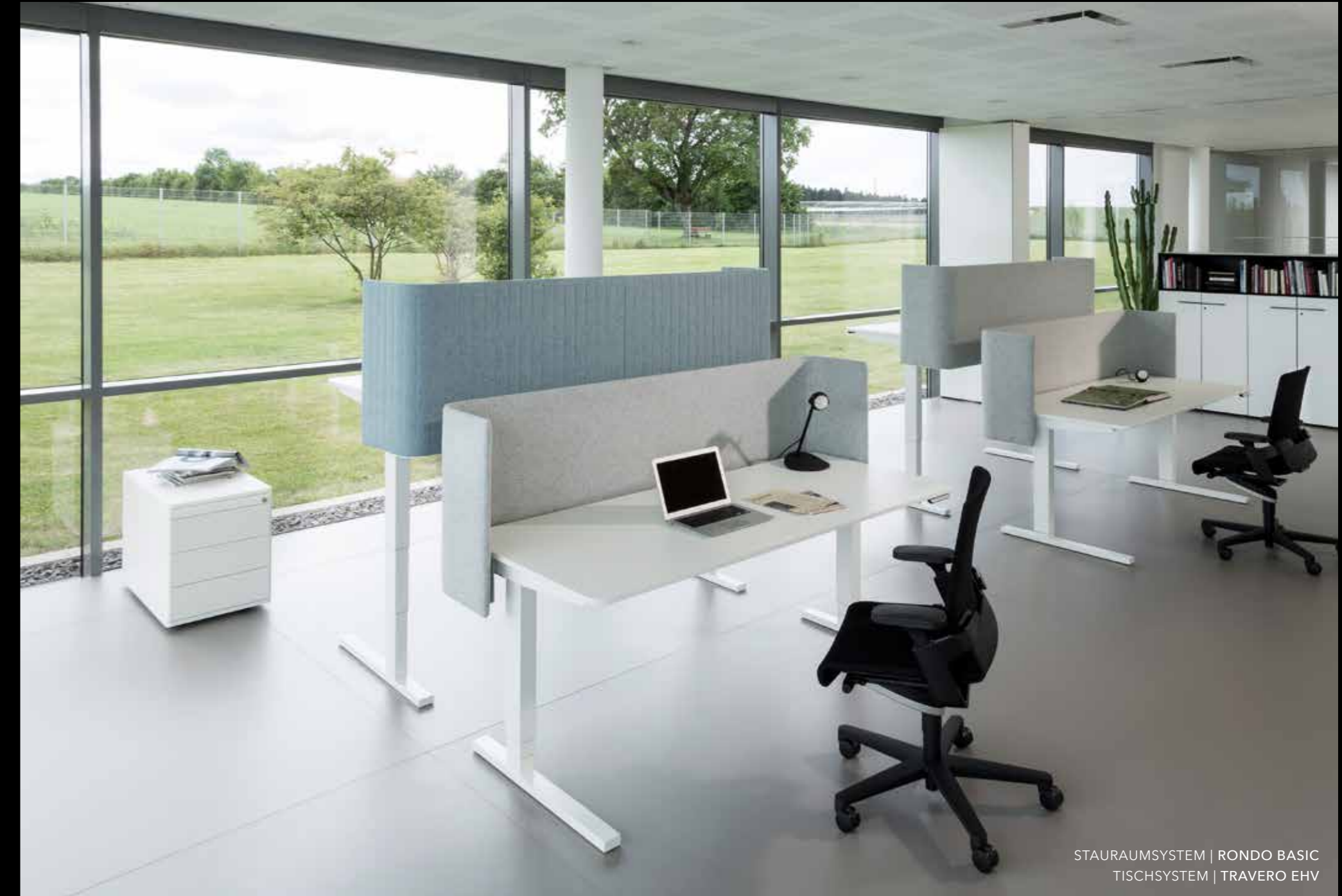
STAURAUMSYSTEM | RONDO BASIC TISCHSYSTEM | TRAVERO EHV